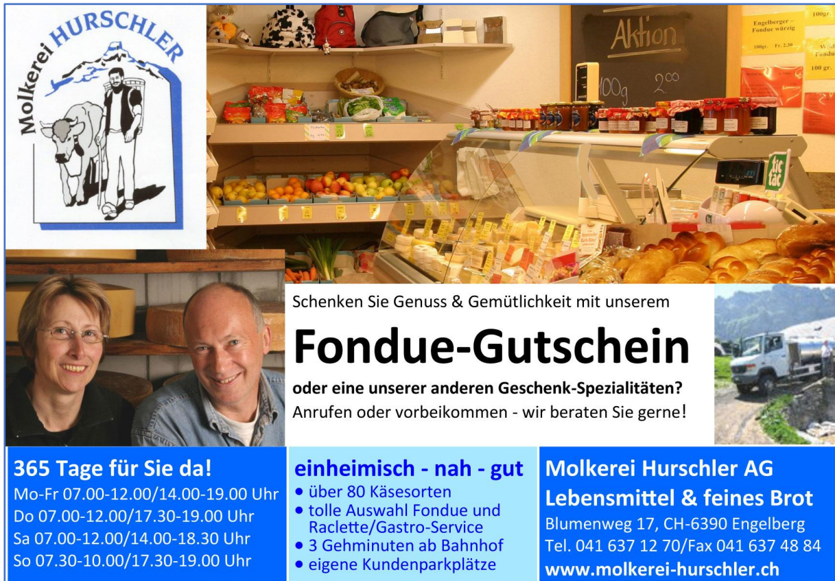
Inserate-Kampagne als eine Massnahme einer umfassenden Marketingberatung (2007)