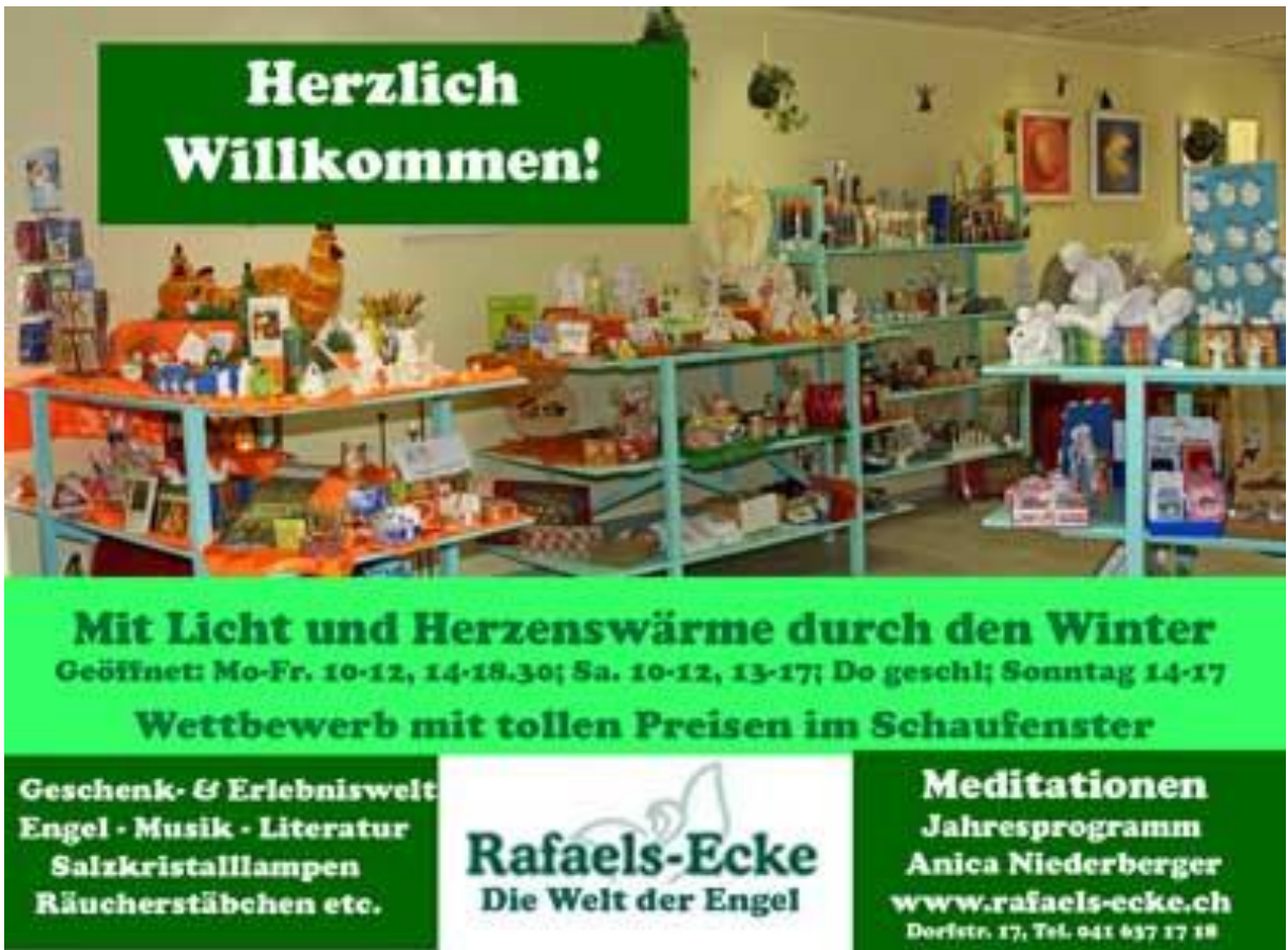
Inserate-Kampagne anlässlich einer Marketingberatung der Engelberger Boutique «Rafaels-Ecke»