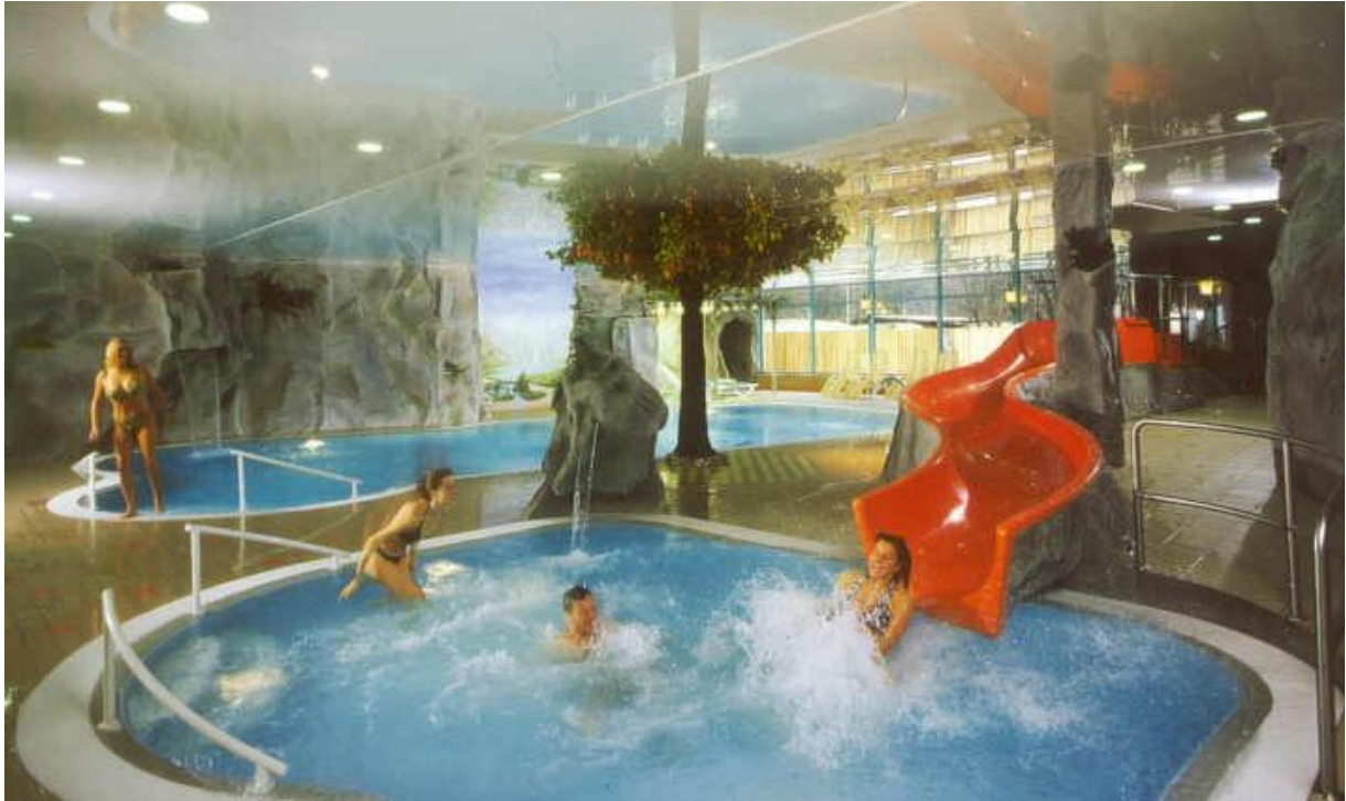
Marketingkonzept und Eröffnungswerbung von Felsenbad und Saunalandschaft Sporthotel Eienwäldli